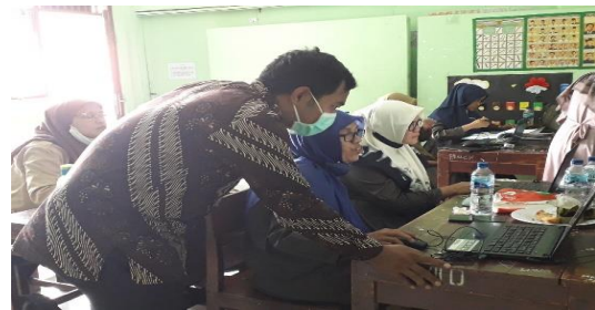
Gambar 2. Pembimbingan peserta dalam membuat PPT oleh Tim Pengabdian.

Ada beberapa tanggapan yang diberikan oleh peserta kepada tim mengenai acara yang dibawakan dan dilakukan yaitu berupa apresiasi mendalam dengan terlihat antusias tinggi. Pengaplikasian computer terhadap guru dalam memahami tata cara membuat serbagai bahan ajar yang menarik. Tim pengabdian juga memberikan motivasi kepada guru-guru untuk dapat memaksimalkan perangkat computer dengan palikasi Power point dengan maksimal untuk proses pembelajaran. Power point adalah media yang berguna dan akan digunakan sebagai pengembangan perangkat pembelajaran untuk meningkatkan kualitas pemngajaran dan pembelajaran. Guru yang mengikuti pelatihan ini adalah semua guru MIM Ciputat dengan disiplin ilmu yang sama yaitu Pendidikan guru madrasah ibtidaiyah (MI). berdasarkan evaluasi kegiatan yang dilakukan oleh tim pengabdian tampak semangat guru-guru dalam membuat media pembelajaran dengan menggunakan aplikasi MS power point untuk diterapkan pada proses pembelajaran pada siswa dikelas masing-masing. Dengan diadakannya pelatihan ini menjadi salah-satu memperbaiki dan meningkatkan mutu Pendidikan menjadi jauh lebih baik dan siswa lebih bersemangat dalam pembelajaran di kelas.