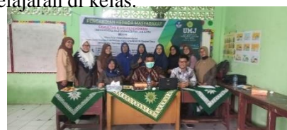
Gambar 3. Foto Bersama antara Tim dan Peserta

Ada beberapa tanggapan yang diberikan oleh peserta kepada tim mengenai acara yang dibawakan dan dilakukan yaitu berupa apresiasi mendalam dengan terlihat antusias tinggi. Pengaplikasian computer terhadap guru dalam memahami tata cara membuat serbagai bahan ajar yang menarik. Tim pengabdian juga memberikan motivasi kepada guru-guru untuk dapat memaksimalkan perangkat computer dengan palikasi Power point dengan maksimal untuk proses pembelajaran. Power point adalah media yang berguna dan akan digunakan sebagai pengembangan perangkat pembelajaran untuk meningkatkan kualitas pemngajaran dan pembelajaran. Guru yang mengikuti pelatihan ini adalah semua guru MIM Ciputat dengan disiplin ilmu yang sama yaitu Pendidikan guru madrasah ibtidaiyah (MI). berdasarkan evaluasi kegiatan yang dilakukan oleh tim pengabdian tampak semangat guru-guru dalam membuat media pembelajaran dengan menggunakan aplikasi MS power point untuk diterapkan pada proses pembelajaran pada siswa dikelas masing-masing. Dengan diadakannya pelatihan ini menjadi salah-satu memperbaiki dan meningkatkan mutu Pendidikan menjadi jauh lebih baik dan siswa lebih bersemangat dalam pembelajaran di kelas.