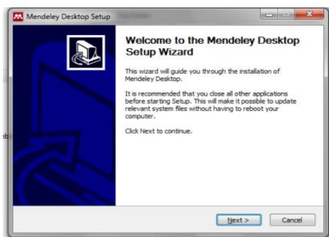
Gambar 2. Menginstal Mendeley desktop

Materi yang disampaikan pada pelatihan ini terdiri dari instalasi software Mendeley dan menjalankan program Mendeley desktop setup , install ms word plugin dan web importer , aplikasi Mendeley dalam membuat kutipan dan daftar pustaka, serta memanfaatkan tools lainnya dalam Mendeley . Pada pengintasan software Mendeley , file software dibagikan sebelum pelaksanaan agar tidak memakan waktu lama. File software Mendeley yang telah diterima bersama-sama diinstal dengan cara mengklik next dan setuju pada petunjuk yang diisyaratkan.