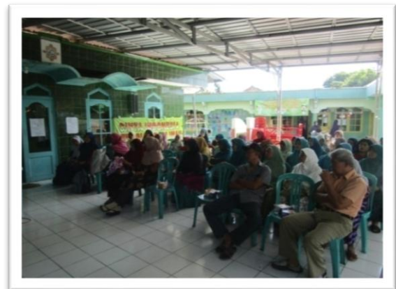
Gambar 2. Sosialisasi program kegiatan PKM

Kegiatan sosialisasi ini dilaksanakan di lokasi kelompok wanita tani. Kegiatan ini dimaksudkan untuk menyampaikan kegiatan-kegiatan yang akan dilaksanakan program pengabdian kepada masyarakat kepada mitra. Adapun dalam sosialisasi ini dihadiri oleh pelaksana PKM, ketua kelompok Wanita Tani, tokoh masyarakat dan unsur dari aparat setempat.