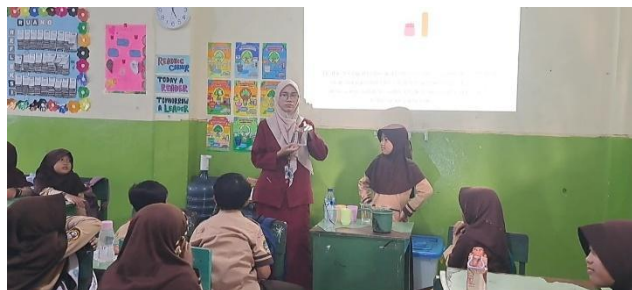
Siklus II, Penerapan Model Pembelajaran CTL

Ketika menerapkan model Contextual Teaching and Learning, Mencontohkan cara pengukuran penghitungan/ pengukuran volume benda dengan alat ukur tidak baku dengan melibatkan salah satu peserta didik untuk membantu di depan kelas. Peneliti mengobservasi selama berjalannya pembelajaran, dan melakukan evaluasi dengan tes, hingga didapatkan nilai pada siklus II dibawah.