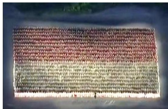
Gambar 1. Bentuk formasi Tari Saman yang menyerupai bentuk bangun datar persegi panjang

Hasil penelitian menunjukkan bahwa Etnomatematika ditemukan dalam tarian tradisional pada pembukaan Asian Games 2018 yaitu tari Saman. Etnomatematika dalam tari Saman pada pembukaan Asian Games 2018 dapat dilihat dari gerakan, pakaian, dan formasi tariannya.