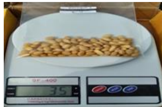
Gambar 5. Berat Kering Biji

Keterangan: Angka angka pada kolom dan baris yang diikuti huruf kecil yang sama adalah yang tidak berbeda nyata menurut Uji lanjut BNJ dengan taraf 5%.