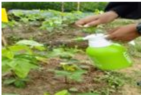
Gambar 3. Pengendalian Hama dan Penyakit