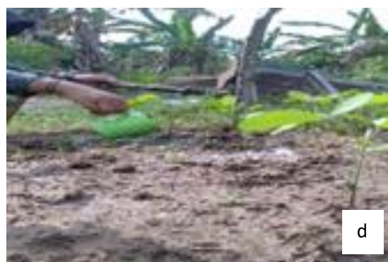
Gambar 2. Pelaksanaan penelitian: lahan penelitian (a), pemberian dolomit (b), pembuatan POC keong maja (c), dan pemberian perlakuan POC keong maja (d)

Pemeliharaan meliputi: penyiraman, penyulaman, penjarangan, penyiangan, pembumbunan dan pengendalian hama dan penyakit ( Gambar 3 ). Parameter pengamatan meliputi: tinggi tanaman (cm), umur berbunga