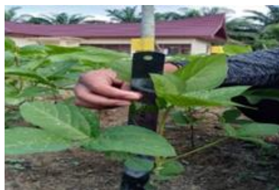
Gambar 4. Tinggi Tanaman

( Gambar 4 ). Dalam hal ini faktor genetik menyebabkan perbedaan yang beragam seperti penampilan fenotif tanaman dengan menampilkan ciri dan sifat khusus yang berbeda antara satu sama lain. Hal ini sesuai dengan pernyataan Gabesius et al. (2012), yang menyatakan bahwa perbedaan susunan genetik merupakan salah satu faktor penyebab keragaman penampilan tanaman.