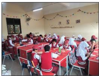
Gambar 1. Model Pembelajaran “ Project Based Learning ”.

Model pembelajaran yang peneliti temukan di kelas 4 merupakan model pembelajaran kreatif yang sangat baik diimplementasikan di dalam maupun di luar kelas. Salah satu model pembelajaran kreatif yang diimplementasikan guru di kelas 4 adalah model pembelajaran kreatif “ Project Based Learning ”. Model ini merupakan model pembelajaran yang mengutamakan proyek dan kreativitas dari suatu karya yang dihasilkan. Setiap proses pembelajaran diciptakan sangat menarik, menyenangkan, dan menghasilkan sebuah karya.