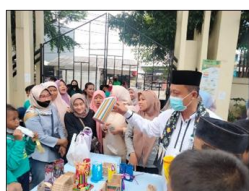
Gambar 3. Hasil Karya Proyek Penguatan Profil Pelajar Pancasila

Kelas lain yang belum mengimplementasikan kurikulum merdeka belajar juga turut terlibat dalam kegiatan pembelajaran. Kegiatan “Market Day” merupakan kegiatan yang melibatkan siswa kelas lainnya, yaitu siswa kelas 2, 3, 5, dan 6. Kegiatan “Market Day” merupakan kegiatan tindak lanjut dari proses pembelajaran kreatif P5 yang telah dilakukan secara bersama-sama. Pada kegiatan tersebut, siswa memamerkan hasil karya mereka kepada seluruh warga sekolah. Warga sekolah yang ikut partisipasi dalam kegiatan tersebut adalah kepala sekolah, seluruh guru dan karyawan SDNS 01, seluruh siswa mulai dari kelas 1 sampai dengan kelas 6. Bahkan kegiatan “Market Day” tersebut melibatkan wali murid dari kelas 1 sampai dengan kelas 6. Sehingga, kegiatan “Market Day” tersebut sangat mendapatkan sambutan yang positif dari semua pihak.