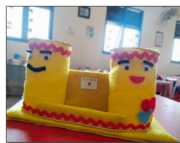
Gambar 2. Metode dan Media Pembelajaran Kreatif

Adapun materi ajar yang diimplementasikan pada pembelajaran ini merupakan materi ajar yang sudah ada dan guru bisa mengembangkan materi tersebut sesuai dengan kemampuan siswanya. Materi pembelajaran P5 yang diimplementasikan di dalam kelas memiliki tema “Kewirausahaan”. Dimana siswa diajak untuk memiliki jiwa wirausaha sejak dini dengan memanfaatkan barang-barang bekas atau sampah yang bisa