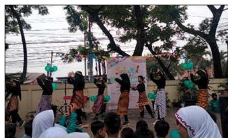
Gambar 4. Partisipasi Siswa lain dalam Menyalurkan Bakat dan Kreativitas