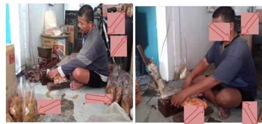
Gambar 1. Posisi Kerja Operator Saat Melakukan Pengemasan

Penelitian ini mengambil obyek pada proses pengemasan emping melinjo. Setelah dilakukan observasi dan wawancara langsung kepada karyawan operator pengemasan, ditemukan keluhan ketidaknyamanan pada posisi kerja operator. Fasilitas kerja yang kurang mendukung karena operator harus duduk bersila saat melakukan pengemasan, posisi penempatan produk yang tidak beraturan, produk yang sudah dikemas hanya diletakan di lantai dan tidak adanya tempat pemisah antara produk yang sudah dikemas dan yang belum dikemas (Gambar 1).