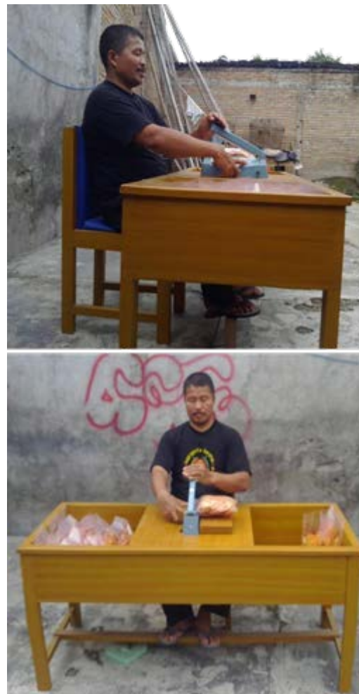
Gambar 4. Posisi Kerja Operator Pengemasan Setelah Perancangan

Berdasarkan gambar dan ukuran rancangan, selanjutnya dibuat menjadi fasilitas kerja yang digunakan untuk memperbaiki posisi kerja operator pengemasan seperti diperlihatkan pada gambar 4 berikut: