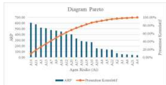
Gambar 3. Diagram Pareto

Setelah dilakukan perhitungan Aggregate Risk Potential maka selanjutnya akan dilakukan evaluasi risiko. Mengacu pada prinsip diagram Pareto, yaitu rasio 80%: 20%, prioritas masalah yang perlu diselesaikan adalah risiko yang memiliki persentase kumulatif hingga mencapai 80% dari peringkat nilai ARP. Penyebab risiko ( Risk Agent ) yang akan dimitigasi berdasarkan nilai ARP menggunakan diagram pareto dapat ditunjukkan pada gambar 3.