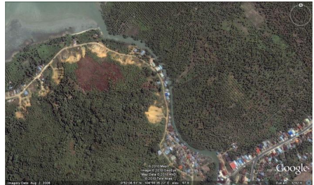
Gambar 11. Sungai Sedau Kabupaten Singkawang