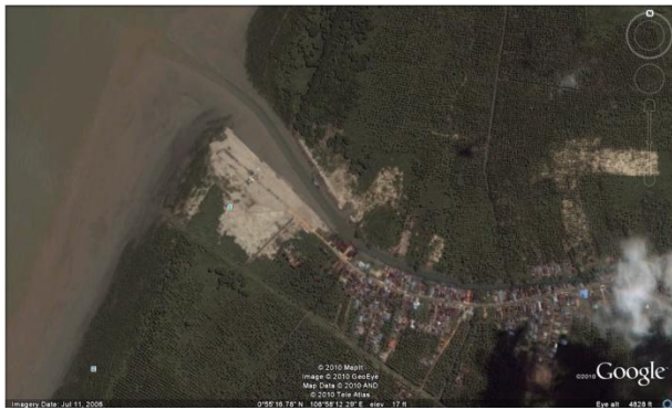
Gambar 2 Sungai Kuala Singkawang

Kedalaman Alur (Ambang Muara) bila air pasang tertinggi : 2,00 M dan dalam keadaan air pasang sedang: 1,80 m. Saat air pasang terendah kedalaman alur mencapai 0,50 m.