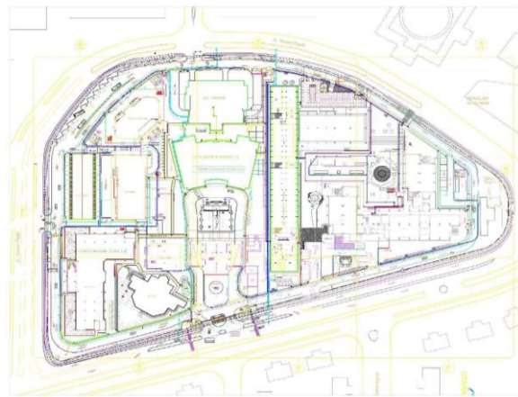
Gambar 3. Denah Kawasan Gedung Kementerian PUPR

Kebayoran Baru adalah sebuah kecamatan yang terletak di kota Jakarta Selatan dan merupakan Pusat Pemerintahan dari Kota Administrasi Jakarta Selatan. Kecamatan ini Sebagian besar merupakan daerah pertokoan (Blok M) dan pusat bisnis