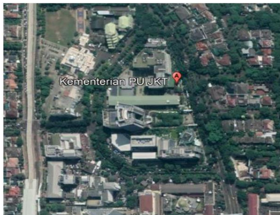
Gambar 2. Lokasi Kawasan Gedung Kementerian PUPR

Kawasan Gedung Kementerian PUPR akan dibangun di atas tanah seluas 5,3846 Ha