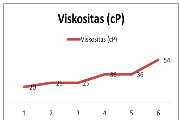
Gambar 1. Tingkat Kekentalan Soygurt dengan Penambahan Ekstrak Lidah buaya

Pada saat pengujian kekentalan dengan menggunakan alat ukur Brookfield viscometer, spindle yang digunakan untuk mengukur yogurt adalah no 64, sedangkan untuk mengukur soygurt dengan berbagai komposisi ekstrak lidah buaya dan ekstrak lidah buaya, adalah no. 61. Hal ini menunjukkan yogurt jauh lebih kental dibanding soygurt dengan berbagai komposisi lidah buaya.