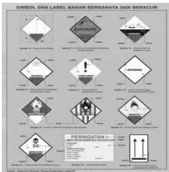
Gambar 2: Beberapa gambar simbol