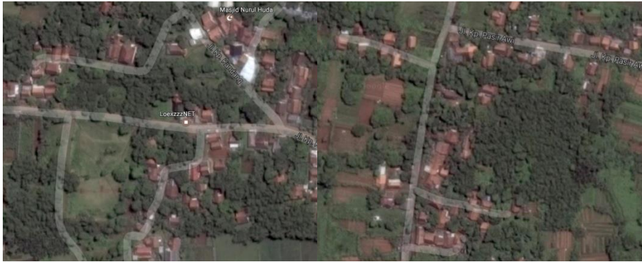
Gambar 2. Peta Pola Orientasi Bangunan di Desa Mekarwangi

Pembagian dan pola ruang berdasarkan Kosmologi Sunda (Garna, 1984) [13]: