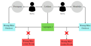
Gambar 3: Alur Perilaku Siswa

Berdasarkan pada tabel di atas, kelompok siswa pada PSF Academy lebih memilih menggunakan ruang yang pencapaiannya tehitung dekat dengan fasilitas lapangan latihan. Berikut gambar diagram alur perilaku siswa.