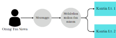
Gambar 5 Alur Perilaku Orang Tua Siswa

Kemudian perilaku kelompok pengguna orang tua siswa pada PSF Academy, orang tua siswa ketika menunggu anak nya yang sedang latihan mereka lebih sering menunggu sembari makan atau minum di Ruang Kantin. Berikut gambar alur perilaku orang tua siswa.