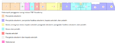
Gambar 2: Zoning Denah Lt. 1

Ruang-ruang yang terdapat di lantai satu bangunan yang merupakan fasilitas pendukung di PSF academy merupakan ruang, (A) Klinik, (B) Ruang meeting private, (C) Ruang sekretariat, (D) Ruang pelatih, (E) Ruang kepala sekolah, (F) Ruang pengelola akademi, (G) Kantin, (H) Ruang pengelola fasilitas akademi, (I) Locker room, (J) Ruang meeting, (K) Area parkir pegawai, (L) Toilet umum.