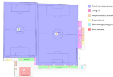
Gambar 1 Zoning Outdoor

Pada skala site plan terdapat fasilitas dan ruang yang terdapat di PSF academy ini yang merupakan fasilitas dan ruang sebagai berikut: (A) Lapangan 1, (B) Lapangan 2, (C) Tribun penonton, (D) Ruang gudang, (E) Area bilas outdoor, (F) Area kursi tunggu, (G) Area parkir khusus pengelola akademi, (H) Pos keamanan, (I) Lapangan basket, (J) Musholla.