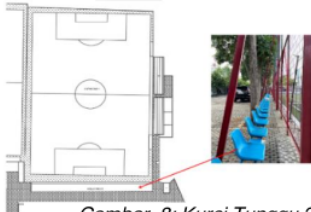
Gambar 8: Kursi Tunggu 2

sedang latihan, mereka biasanya menunggu sembari makan atau minum di kantin pada PSF Academy ini.