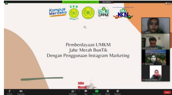
Gambar 2. Presentasi hasil produksi dari photoshoot & design feeds Instagram .

Melakukan presentasi hasil produksi berupa photoshoot dan design feeds Instagram kepada mitra via zoom meetings .