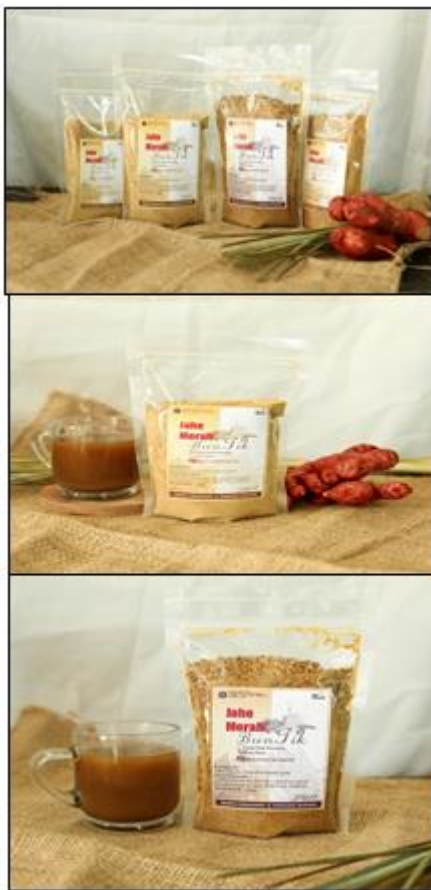
Gambar 1. Sesi Photoshoot Produk Jahe Merah BunTik

Pelaksanaan program online ini dapat terealisasi dengan baik dan sesuai rencana. Pertama, mulai dari meminta surat permohonan mitra untuk bekerja sama pada KKN 2021 ini, lalu melakukan sesi photoshoot