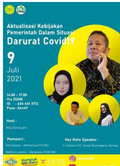
Gambar 1. Poster Webinar

Program webinar ini dilakukan untuk memberikan wawasan dan pengetahuan kepada semua warga khususnya warga yang berada di Kecamatan Bojonegara tentang pelaksanaan salah satu kebijakan untuk penanganan penyebaran Covid-19 yaitu PPKM Darurat. Dalam webinar ini juga memberikan informasi kepada warga Kecamatan Bojonegara terkait Vaksinasi. Dari program yang sudah di rencanakan ini diharapkan dapat meningkatkan pengetahuan masyarakat khususnya warga Kecamatan Bojonegara tentang pelaksanaan kebijakan PPKM yang akan dilaksanakan serta merubah stigma masyarakat mengenai vaksinasi covid-119 yang dilaksanakan pemerintah.