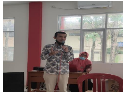
Gambar 1. Penjelasan Materi tentang Penyusunan Persediaan