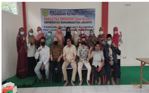
Gambar 4. Sesi Foto Bersama Tim Pengabdian Masyarakat dan Pengurus Pondok Pesantren Darul Hikmah Tangerang