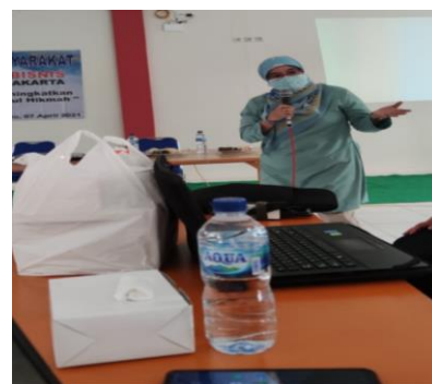
Gambar 2. Penjelasan Materi tentang Penyusunan Persediaan