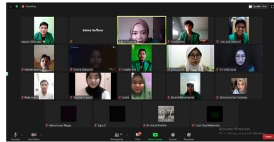
Gambar 4. Peserta Kegiatan Podcast Koneksi Untuk Masyarakat.