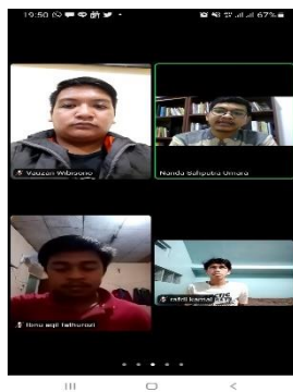
Gambar 3. Diskusi Kelompok dan Zoom Meeting Bersama DPL.

Dalam kegiatan Kuliah Kerja Nyata (KKN) Berbasis Online ini terdapat program – program yang dijalankan baik kelompok ataupun individu, hal ini dikarenakan Kuliah Kerja Nyata Berbasis Online dilaksanakan di domisili masing-masing mahasiswa karena mencegah penyebaran Covid - 19. Maka dari itu dalam kegiatan ini penyusun membedakan kegiatan yang dilakukan oleh individu dengan kegiatan kelompok sebagaimana berikut: