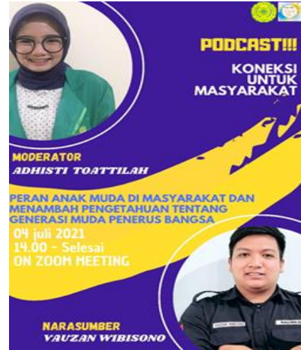
Gambar 1. Podcast Koneksi untuk masyarakat

Angka generasi muda makin hari semakin bertambah, penyuluhan dan sosialisasi kepada generasi muda merupakan kegiatan yang wajib dilakukan oleh setiap kalangan masyarakat, tidak harus diberikan oleh kawula tua, melainkan kawula muda itu sendiri bisa membagi pengalaman dan cerita untuk membangun jiwa sosial dan kepemimpinan yang tertidur pada anak muda.