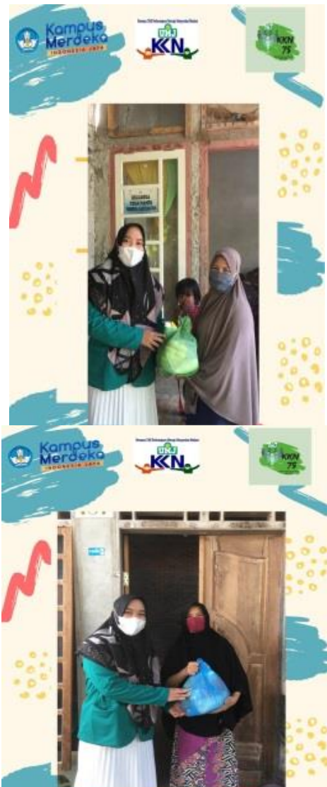
Gambar 3. Kegiatan Pembagian Sembako

Program UMJ Peduli ini dilaksanakan di Gampong Arafah, Kecamatan Samadua dengan membagikan sembako kepada warga desa yang terdampak Covid 19.