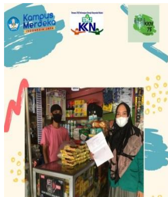
Gambar 2. Bertemu Mitra

Pada tahap ini masing-masing tim bertemu dengan Mitra untuk membahas rancangan program dan kesanggupan mitra untuk menjadi bagian dari Kuliah Kerja Nyata UMJ 2021.