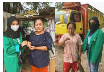
Gambar 4. Pembagian Vitamin C

Program ini kami lakukan di tanggal 21 Juli dan 23 Juli 2021. Kami memberikan vitamin c kepada anak-anak mulai dari usia 5 tahun hingga orang dewasa. Warga disana sangat antusias untuk menerima vitamin c.