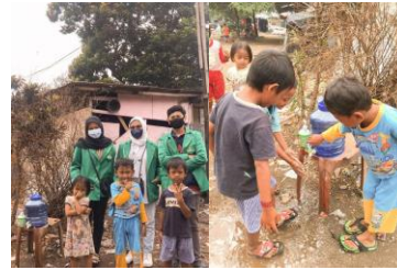
Gambar 2. Mengedukasi cara mencuci tangan yang benar

tempat mencuci tangan terlebih dahulu setelah itu kami memberikan edukasi cara mencuci tangan yang benar kepada anak-anak yang ada disana.