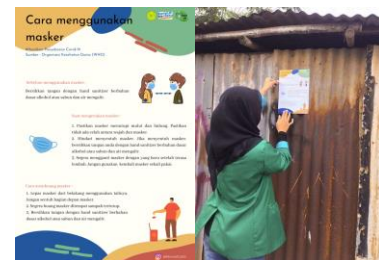
Gambar 3. Pembuatan dan pemasangan poster kesehatan

Program ini kami lakukan pada tanggal 21 Juli 2021. Pemasangan poster kesehatan kami lakukan ditempat-tempat yang strategis, seperti diwarung dan dipersimpangan jalan.