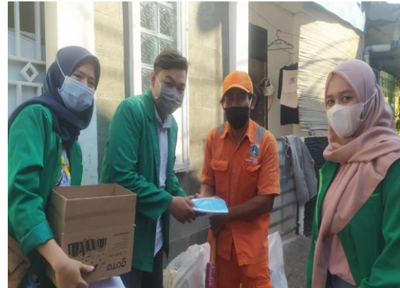
Gambar 2. Pembagian Masker dan Handsanitizer kepada masyarakat RW 007

Pelaksanaan program Kuliah Kerja Nyata (KKN) Universitas Muhammadiyah Jakarta (UMJ) kelompok 61 berjalan dengan baik, tetapi ada beberapa program yang harus di evaluasi, yaitu dari kegiatan sosialisasi, pembagian masker dan handsanitizer terdapat kendala berupa terbatasnya masker dan handsanitizer untuk masyarakat, karena mahasiswa memiliki keterbatasan dalam memberikan masker dan handsanitizer. Sehingga dari kendala tersebut kelompok kami mengharap adanya bantuan penambahan masker dan handsanitizer serta partisipasi aktif dari satgas Covid-19 dan warga setempat.