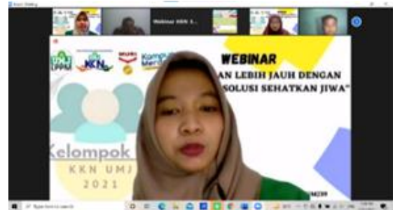
Gambar 4. Moderator Memandu Kegiatan Webinar