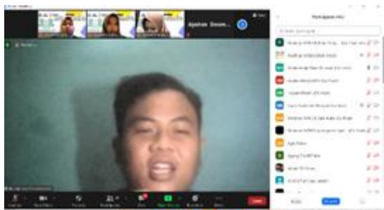
Gambar 6. Materi 2 “Menjaga Kesehatan Jiwa”

menjaga Kesehatan jiwa, yaitu dengan cara Respons emosi, Respons psikologis, Strategi coping, SelfHealing , seperti shalat, memperbaiki pola hidup bahagia dan bersyukur dan Selflove .