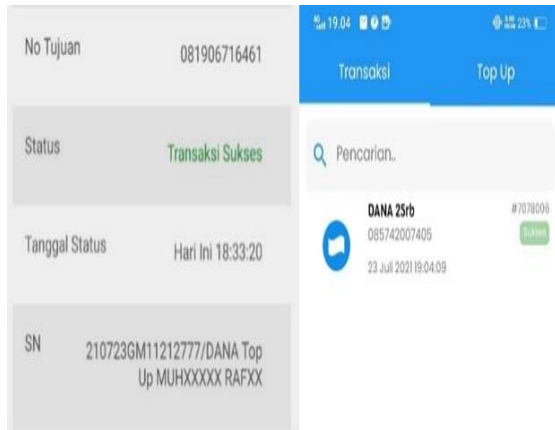
Gambar 10. Bukti Pemberian Doorprize