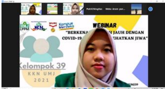
Gambar 2. Pembukaan Kegiatan Webinar