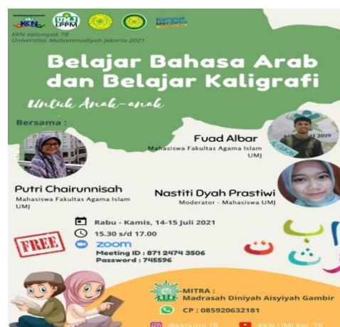
Gambar 1. Poster Webinar

Hasil lainnya dari program ini adalah para tenaga pendidik di Madrasah Diniyah Aisyiyah Gambir menjadi lebih kreatif dan inovatif dalam menyampaikan materi pembelajaran kepada peserta didik terutama materi Bahasa Arab tidak berfokus pada buku. Serta menambah dan mendorong para tenaga pendidik untuk lebih memanfaatkan dan mempelajari teknologi, mengingat situasi dan kondisi saat ini mengharuskan pembelajaran dilakukan daring (online) Diharapkan, dengan ilmu yang kelompok berikan selama kegiatan berlangsung, dapat bermanfaat untuk ke depannya bagi peserta. Berikut terdapat beberapa dokumentasi selama kegiatan berlangsung: