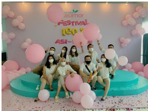
Gambar 2. Festival 100% Asi for More

Hasil yang dapat dilihat dari strategi pemasaran yang dilakukan account executive dengan berbagai macam media komunikasi mendapatkan kenaikan jumlah followers dalam