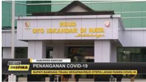
Gambar 3. Hasil tayangan Berita Inspira