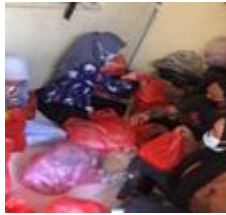
Gambar 3. Pengemasan keperluan Baksos

30 bungkus, pembelian handsanitizer dan masker melalui social media yaitu via shopee.