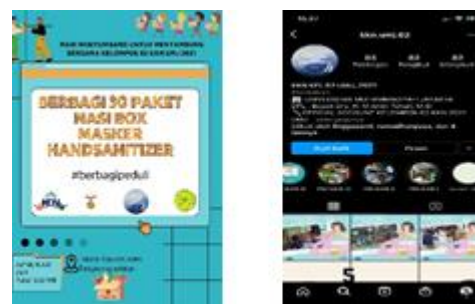
Gambar 5. Media Sosial Kelompok 61

Praktiknya juga membuat sebuah poster yang berkaitan dengan Baksos yaitu poster tentang pemberitahuan penyaluran baksos yang berupa makanan, handsanitizer, dan masker yang telah dipublikasikan melalui media promosi di media sosial milik KKN UMJ kelompok 62 yaitu instagram dan kanal channel youtube. Semua kegiatan yang kami lakukan terdokumentasi dengan sangat baik dan pastinya terstruktur.