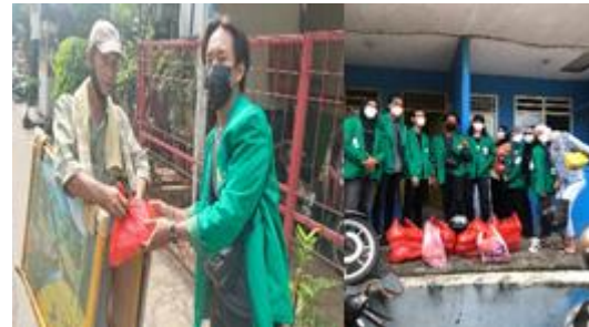
Gambar 4. Penyaluran Baksos

membunuh semua jenis kuman atau tidak seampuh mencuci tangan dengan air dan sabun. Begitu pun masker dibuat untuk melindungi dari droplet yang di keluarkan oleh orang lain agar tidak masuk ke hidung dan mulut kita ataupun sebaliknya, agar droplet kita tidak mengenai orang lain karena kita tidak tahu kita atau lawan bicara kita yang sedang menjadi pembawa virus.