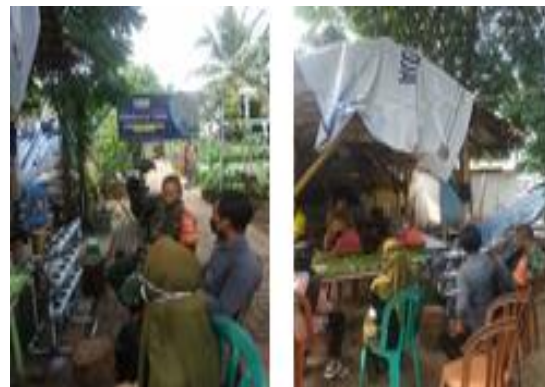
Gambar 2. Diskusi perencanaan program

Menyampaikan rancangan apa saja yang telah kami pikirkan dan didiskusikan bersamaan dengan warga kampung Tidar, supaya menjalankan Baksos akan menjadi lancar dan aman.