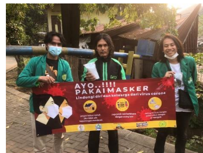
Gambar 3. Pembagian Paket masker kepada bapak pengemudi ojek online

Setelah memiliki izin dan mendapatkan mitra kami bergegas menjalankan tugas berikutnya yaitu melakukan pembagian 50 paket masker dan handsanitaizer kepada seluruh masyarakat yang beraktivitas diluar ruangan. Dimulai dari para pedagang seperti ibu-ibu penjaga warung, pedagang kaki lima, pengemudi ojek online serta para warga yang sedang melintas dikawasan Taman UMJ.