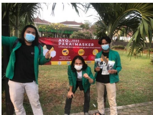
Gambar 4. Pemasangan Spanduk Protokol Kesehatan

agar masyarakat yang melihat dan melintasi kawasan tersebut selalu memperhatikan tentang protokol kesehatan yang benar dengan begitu laju penyebaran virus covid19 dapat terkendali dan masa pandemic ini segera berakhir nantinya.