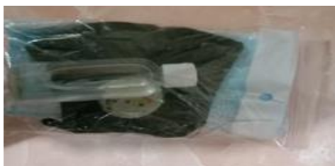
Gambar 1. Paket Masker dan Hand sanitaizer

Pada mulanya dalam menyusun program kerja KKN ini, kami menyusun konsep membagikan masker serta hand sanitaizer untuk DKM masjid yang ada di wilayah pondok ranji Tangerang selatan, namun dikarenakan kurangnya persiapan tersebut kami merubah dengan membagikan masker dan handsanitaizer untuk setiap masyarakat yang sedang beraktivitas diluar rumah dengan membuat 50 paket berisi 4 masker medis, 1 masker kain, dan 1 botol hand sanitaizer ukuran 60ml.