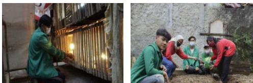
Gambar 5. Pelaksanaan Kegiatan