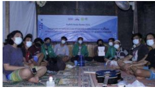
Gambar 2. Survei Lokasi