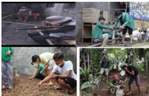
Gambar 4. Pembuatan Fasilitas Pertanian, Peternakan, dan Perikanan