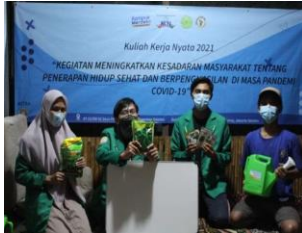
Gambar 3. Persiapan Tempat dan Bahan