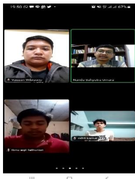
Gambar 1. Diskusi Kelompok dan Zoom Meeting Bersama DPL.

Dalam kegiatan Kuliah Kerja Nyata (KKN) Berbasis Online ini terdapat program – program yang dijalankan baik kelompok ataupun individu, hal ini dikarenakan Kuliah Kerja Nyata Berbasis Online dilaksanakan di domisili masing-masing mahasiswa karena mencegah penyebaran Covid - 19. Maka dari itu dalam kegiatan ini penyusun membedakan kegiatan yang dilakukan oleh individu dengan kegiatan kelompok sebagaimana berikut: