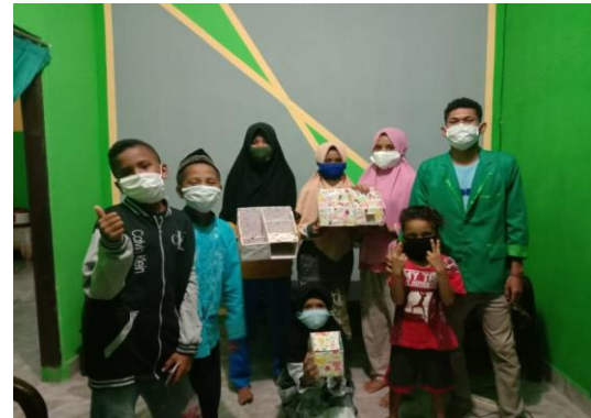
Gambar 2. Peserta Kegiatan kerajinan tangan

daya kreatif yang cukup baik. mka sasaran kegiatan ialah kalangan pelajar SD-SMP. Dihadiri oleh perwakilan dari Kompas Lembata total peserta yang hadir 8 orang.