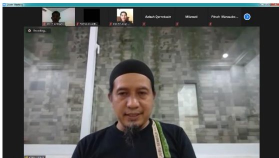
Gambar 1. Pelaksanaan Webinar

Gambar 1 menunjukkan kegiatan ketika program webinar Tata Cara Pelaksanaan Qurban Menurut Syariat Islam Pada Masa Pandemi Covid-19 dilaksanakan yaitu kajian terkait dengan Tata Cara Pelaksanaan Qurban Menurut Syariat Islam Pada Masa Pandemi Covid-19. Webinar ini dilaksanakan pada hari Sabtu, 17 Juli 2021 pukul 20.00 – selesai melalui aplikasi zoom meeting dengan sasaran yang ditujukan yaitu masyarakat pada umumnya. Webinar dibawakan oleh pemateri hebat yaitu,