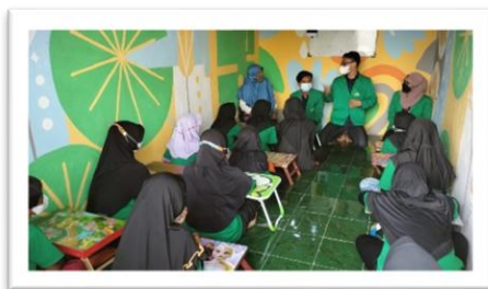
Gambar 4. proses microteaching dan fun games

Memberikan microteaching kepada anak-anak dan mengisi pelajaran dengan diselipkan fun games, pada kegiatan ini kita menarik pola pikir anak untuk berhitung lebih cepat dan berani unjuk gigi di depan kelas