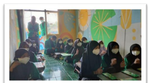
Gambar 3. Proses pemberian contoh 3M