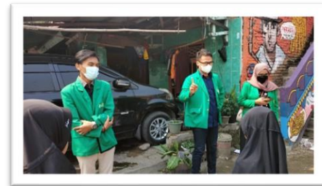
Gambar 2. memberi pengetahuan bahaya virus covid-19.

Sebelum dimulai proses penyontohan 3M kami memberikan edukasi tentang bahaya virus covid19 ini, bagaimana baiknya mencuci tangan, menjaga jarak dan memakai masker dan apa manfaat itu bagi mereka saat pandemic seperti ini