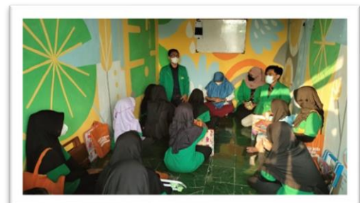
Gambar 5. proses pendampingan belajar mengajar

Proses pendampingan ini dilakukan untuk mengawasi agar anak-anak merasa terpantau dan merasa diperhatikan oleh kakak-kakak yang sedang melakukan KKN