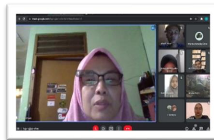
Gambar 1. membahas progress bersama DPL

Selama kegiatan KKN berlangsung kami melakukan diskusi bersama dengan dosen pembimbing lapangan dan kelompok terkait bimbingan, teknis, dan laporan perkembangan kegiatan melalui Zoom Meeting yang diselenggarakan tiap minggunya untuk mendapatkan tanggapan dan evaluasi atas apa yang kami laksanakan di lapangan.