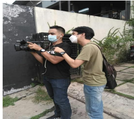
Gambar 1. Proses Ketika ingin syuting Jalan-jalan hayu