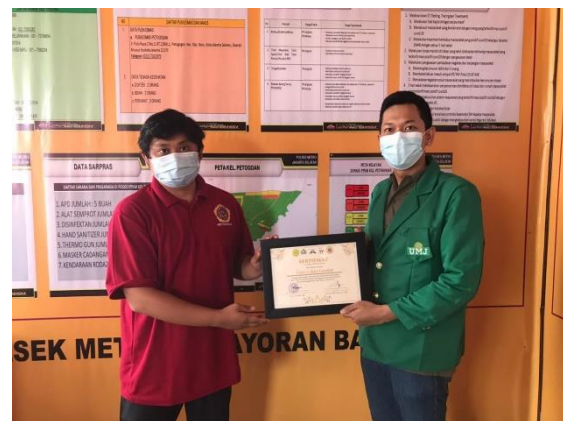
Gambar 4. Penyerahan sertifikat kepada mitra oleh Ketua Kelompok KKN 73

Setelah terlaksananya program Diskusi Sejenak : “Peran Pemuda Dalam Mencegah Penyebaran Covid-19”, anggota Kelompok 73 KKN UMJ menyerahkan sertifikat kepada mitra.