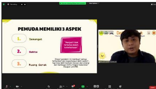
Gambar 2. Pemaparan Materi oleh Ketua Karang Taruna Kelurahan Petogogan