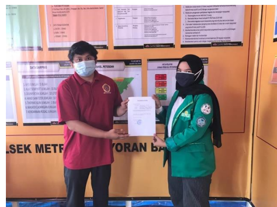
Gambar 5. Penyerahan dokumen oleh Sekretaris Kelompok KKN 73