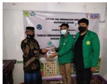
Gambar 4. Pembagian buku.

Program UMJ PEDULI ini dilaksanakan di Desa Pesanggrahan Bintaro dengan membagikan Masker dan buku kepada anak yatim dan dhuafa yang terkena dampak COVID- 19.