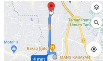
Gambar 1. Denah Yayasan cikal mandiri Pesanggrahan

Yayasan Cikal Mandiri Yatim dan Dhuafa Pesanggrahan Jakarta Selatan berada di jalan Jl. Garuda No.36, RW.6, Kel Pesanggrahan, Kec. Pesanggrahan, Kota Jakarta Selatan, Daerah Khusus Ibukota Jakarta 12320. Yayasan Cikal Mandiri ini berada sekitar 1,5 km dari Jl. Kodam Bintaro,