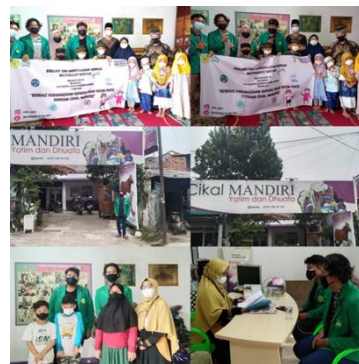
Gambar 3. Pelaksanaan kegiatan KKN.

Dalam program ini membantu memberikan penyuluhan tentang sejarah covid-19 dan juga varian-varian covid yang telah tersebar di seluruh media.