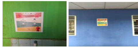
Gambar 5. Poster Keefektifan Masker Double

disebarluaskan melalui media sosial seperti Instagram dan media sosial lainnya.