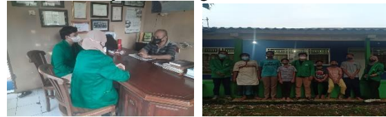
Gambar 2. Survei Lokasi dan Persiapan Pelaksanaan Program

Selain itu, tim pengabdian mendiskusikan sistem pelaksanaan program kerja dan waktu pelaksanaan bersama pengurus Panti Asuhan Muhammadiyah Sawangan.