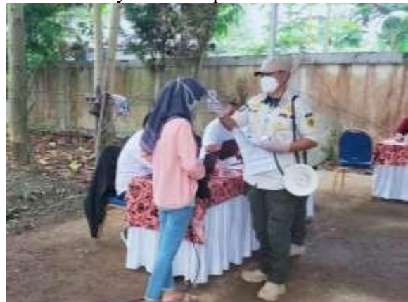
Gambar 3. Meja Pendaftaran Peserta Vaksinasi

Pendaftaran peserta vaksinasi dilakukan dengan pengumpulan berkas yang untuk setelahnya data diinput kedalam sistem.