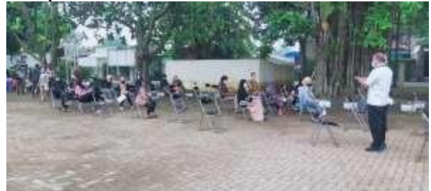
Gambar 2. Pemenuhan Syarat Administrasi

Pemenuhan berkas administrasi dilakukan dengan mengarahkan Warga untuk mengambil formulir di kantor Kecamatan untuk setelahnya mengisi formulir tersebut di kursi-kursi yang telah disediakan. Peserta vaksinasi diminta untuk menggunakan alat tulis pribadi dan tidak berkerumun.