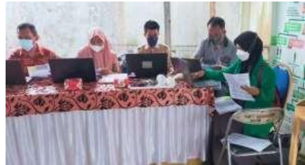
Gambar 5. Proses Input Data ke Sistem

Berkas peserta akan diambil dan diserahkan kepada tim input data agar dimasukkan kedalam sistem. Data yang dimasukkan kedalam sistem yaitu biodata sesuai Kartu Tanda Penduduk serta hasil screening kesehatan. Data diinput kedalam sistem Primary Care BPJS Kesehatan yang untuk setelahnya akan masuk ke sistem pencetakan kartu vaksinasi. Data yang dimasukkan seperti biodata sesuai Kartu Tanda Penduduk serta hasil screening kesehatan. Data ini nantinya akan masuk secara otomatis kedalam sistem utama Kecamatan setempat.