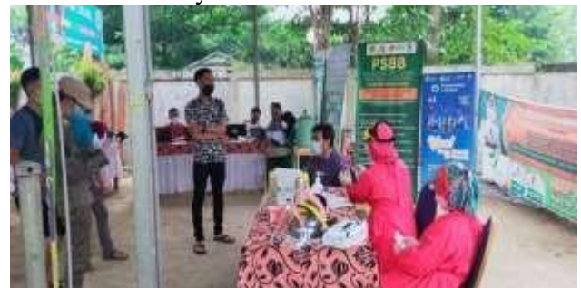
Gambar 6. Pemberian Vaksin

Tim medis yang tersedia di pelaksanaan vaksin sangatlah tertib protokol kesehatan, mereka memakai pelindung diri karena akan berinteraksi kepada peserta vaksin yang akan diberi vaksin. Setelah di screening para peserta langsung ke vaksinator untuk di suntikkan vaksin, baik dosis pertama maupun dosis ke dua. Tempat antara laki-laki dan perempuan pun dipisah, demi kenyamanan para peserta. Setelah penyuntikan vaksin para peserta diharuskan untuk beristirahat beberapa menit terlebih dahulu sambil menunggu sertifikat vaksinnya selesai dibuat.