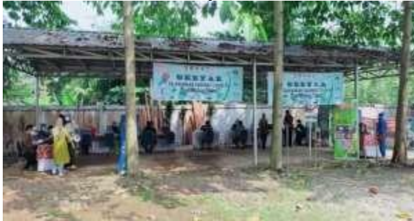
Gambar 4. Screening

Screening dilakukan dengan tim medis yang ada. Hal-hal yang dilakukan dalam screening seperti pengukuran tensi darah, berat badan dan riwayat kesehatan. Warga dengan tensi tinggi tidak diperbolehkan untuk mengikuti vaksinasi, warga tersebut diminta untuk istirahat terlebih dahulu untuk menurunkan tensi darahnya.