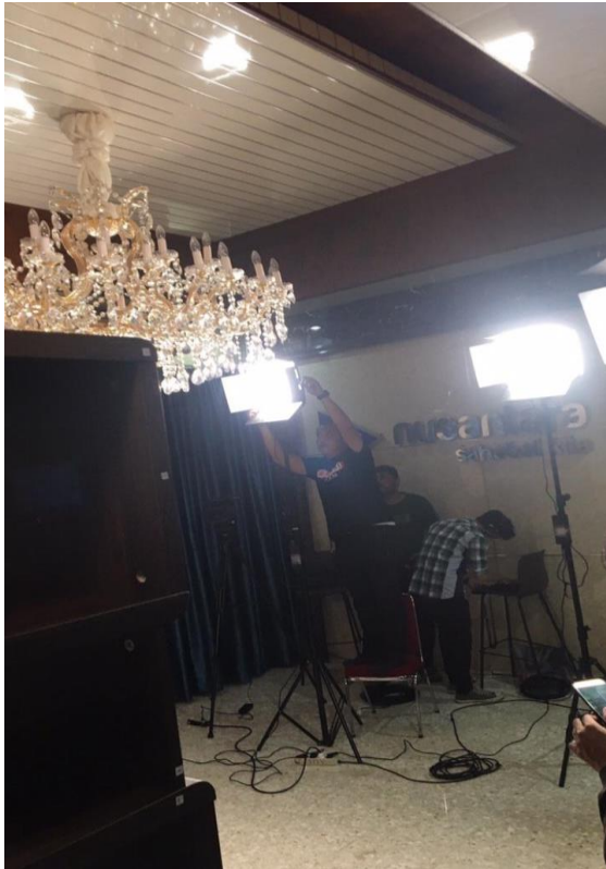
Gambar.3 Shoting salah satu program acara

Melaksanakan shoting salah satu program acara yang akan ditayangkan di Nusantara TV