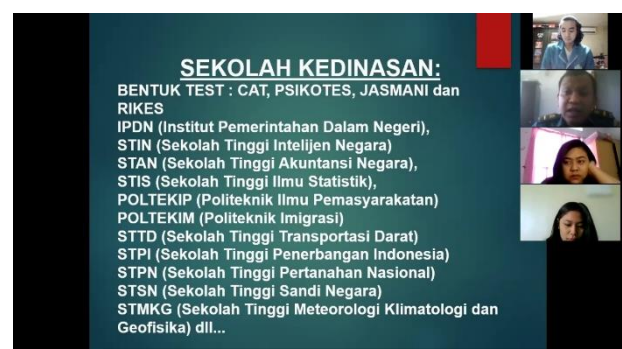
Gambar 3.2 Pemaparan Materi