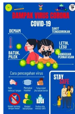
Gambar 3. Membuat Poster Tentang Dampak Dan cara Mencegah Virus Corona (Covid19)

Pelaksanaan program KKN Mandiri Kelompok 36 dengan membuat poster dengan tema Dampak dan Cara Mencegah Covid 19 Di masa Pandemi, Pembuatan Poster ini memiliki tujuan untuk menghimbau kepada Seluruh Masyarakat agar selalu berhati-hati dan selalu patuhi Protokol Kesehatan dan dampak dari covid 19 ini sangat berbahaya