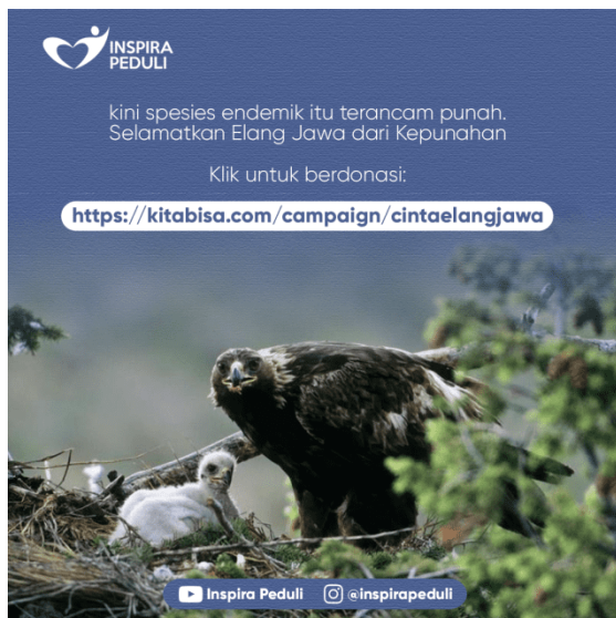
Gambar 4. Buka Donasi

Maksud dari headline tersebut adalah untuk memberikan wadah berdonasi setelah melihat tentang Elang Jawa yang kini menjadi perhatian bersama.