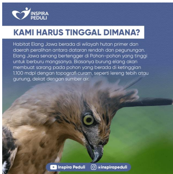
Gambar 2. Kami Harus Tinggal Dimana?

Disisi lain sebagai mitra KKN pihak Inspira TV mendapat hasil dari terselenggaranya program tersebut yang dijalankan, yaitu mendapatkan keringanan dalam melaksanakan program Inspira Peduli dengan dibuatkannya poster infografis di Instagram @inspirapeduli maupun @inspiratv.