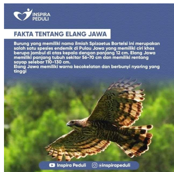
Gambar 4. Fakta Tentang Elang Jawa

Maksud dari headline tersebut adalah untuk menyadarkan masyarakat Indonesia bahwa hewan endemik yang berasal dari pulau Jawa ini kini populasinya hanya sedikit dan menjadi kategori hewan yang terancam punah.