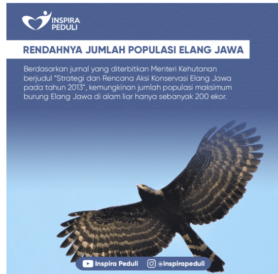
Gambar 3. Rendahnya Jumlah Populasi Elang Jawa

Maksud dari headline “Kami Harus Tinggal Dimana?” adalah untuk meyakinkan masyarakat Indonesia bahwa kini habitat asli Elang Jawa terancam karena maraknya perburuan dan pembabatan hutan secara liar. Hal ini mengakibatkan habitat Elang Jawa tersebut akan hilang jika hal tersebut dibiarkan.