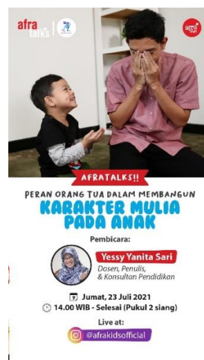
Gambar 1. Pamflet dari seminar online