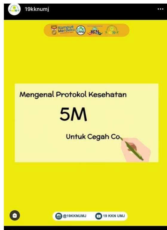
Gambar 8. Konten media sosial 5M