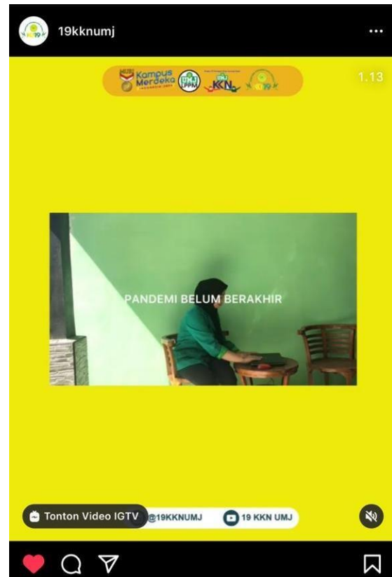
Gambar 7. Ide konten bertahanlah walau jenuh tapi kita tetap harus menghadapi pandemic ini.

Ide konten ini adalah sebagai bentuk inovasi mahasiswa dalam mengemas informasi yang akan di bagikan kepada publik secara daring , melalui media sosial . Kami membuat informasi terkait dengan khususnya kesehatan dan Covid 19 karena ha ini penting mengingat kita masih berjuang bersama melawan pandemi. Konten tersebut di kemas dalam bentuk video atau infografis yang menarik dan mudah di baca . Sebagai tujuan untuk memberikan informasi lebih kepada masyarakat akan bagaimana menanggulangi Covid -19. Seperti membuat video PSA serta infografis .