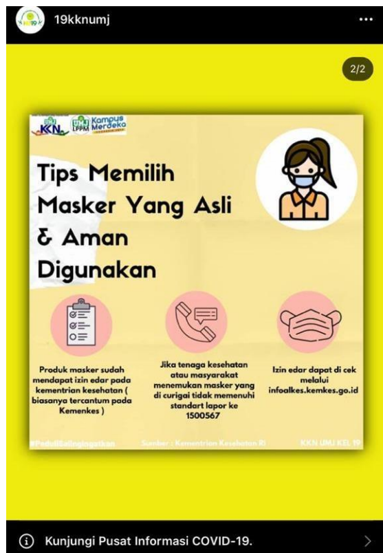
Gambar 9. Konten media sosial tips memilih masker