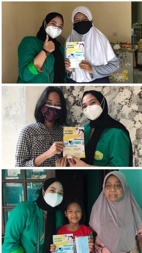
Gambar 3. Kampanye Double masker dan memberikan masker