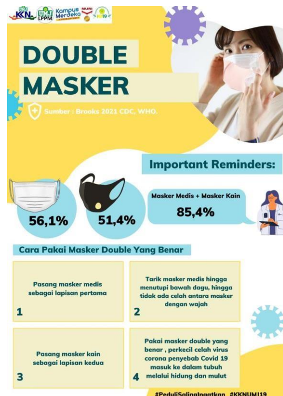
Gambar 1. Infografis, Mengenai Double Masker Akan di Cetak Brousur.

Selain membagikan brousur , penulis juga membagikan double masker tersebut berupa masker medis dan masker kain, yang nantinya akan langsung di pakai oleh warga setelah di beritahukan mengenai informasi tersebut .