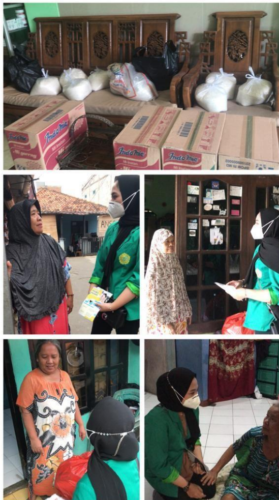
Gambar 6. UMJ PEDULI bantuan sosial berupa sembako