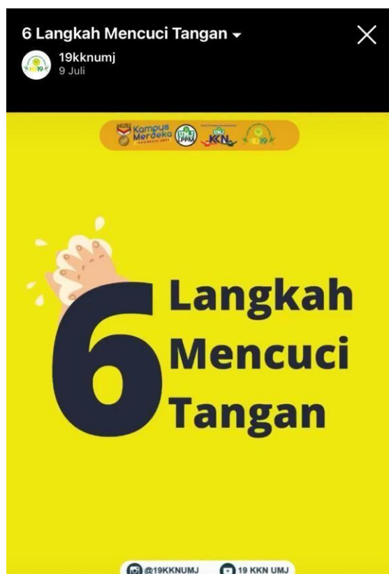
Gambar 10. Konten media sosial 6 langkah mencuci tangan