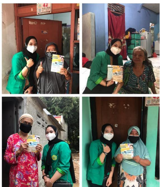
Gambar 4. Kampanye Double masker dan memberikan masker