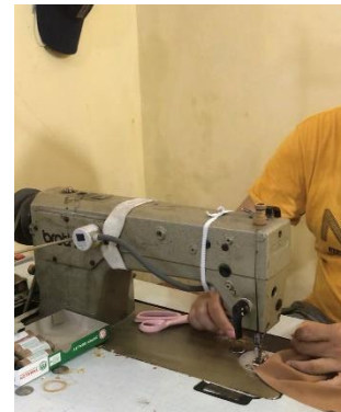
Gambar 1. Mengikuti Proses Produksi IKM Konveksi “Ar Risky Collection”.

dilakukan, setelah itu kami berbincang seputar konveksi “Ar Risky Collection”. Kemudian kami mengikuti proses produksi yang dilakukan oleh para karyawan konveksi “Ar Risky Collection”, dari mulai pemilihan bahan, penggambaran pola, pemotongan bahan dan membentuknya sesuai pola, proses menjahit bahan secara bertahap sampai akhirnya menjadi sebuah busana wanita muslim. Kemudian kami membuat akun Shopee yang bernama “risky_collection_”. Kelompok kami juga memberikan arahan mengenai bagaimana cara memasukan produknya, bagaimana cara mempromosikannya melalui Shopee live, dan juga bagaimana cara pengiriman barangnya sampai ke konsumen.