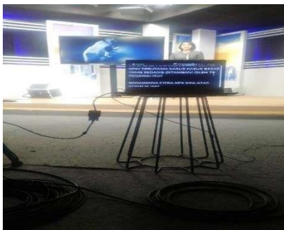
Gambar 2. Kegiatan Mempersiapkan Script berita

Berita Televisi biasanya menggunakan Materi agar penonton bisa memahami konteks yang disiarkan di program tersebut. Setelah membuat naskah berita, langkah selanjutnya yaitu mencari sebuah Bahan materi berita yang bersifat gambar ataupun menggunakan Video yang bisa dicari di situs-situs tertentu Membuat atau merancang sebuah naskah berita untuk siaran acara “Nusantara Petang” dan mendownload gambar email, reuters, youtube untuk nusantara petang, Memperisapkan script berita yang selanjutnya dimasukan ke prompter, Mencari materi atau bahan-bahan berita dari laman tertentu, Membantu proses sesi kegiatan siaran di studio, Cek hasil editig program nusantara petang, Membantu program “Apa Kata Dunia”.