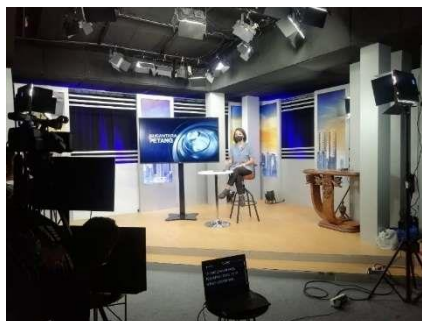
Gambar 1. Kegiatan Membantu proses sesi siaran di studio

Program Merdeka Belajar Kampus Merdeka (MBKM) merupakan salah satu program unggulan yang dikeluarkan oleh Kementerian Pendidikan dan Kebudayaan. Mahasiswa diharapkan dapat meningkatkan soft skill dan hard skill dengan mengikuti salah satu dari delapan program yang disarankan. Link and match merupakan kebijakan awal pada tahun 1990-an saat program MBKM ditingkatkan. Kajian ini bertujuan untuk mengungkap kepentingan industri yang tertanam dalam kebijakan MBKM dengan mengkaji konsep dan desain pendidikan di Indonesia. Penelitian kepustakaan terhadap ide-ide tersebut diulas. Jurnal dan buku yang bereputasi baik dikumpulkan dan diulas sementara konsep kritis pendidikan dilakukan sebagai alat analisis. Teori pendidikan yang dikemukakan oleh Illich (2000), Walker (1981), dan Nabhani (2001) digunakan untuk menelusuri Industrialisasi pendidikan dalam kebijakan MBKM. Dalam pelaksanaan KKN berbasis Online ini program nya bersamaan dengan magang MBKM yang merupakan magang dari Kampus FISIP UMJ yang dilaksanakan di Nusantara TV.