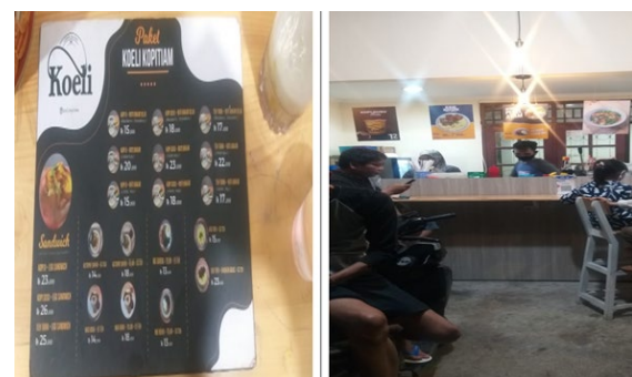
Gambar 1. Situasi Café Koeli Kopittiam

Permasalahan yang dialami mitra yaitu belum memiliki laporan keuangan yang dapat menyajikan informasi secara penuh mengenai kondisi keuangan usaha. Berapa besat omzet penjualan per bulan? Berapa tingkat keuntungan yang diraih setiap bulannya? Hal ini disebabkan karena masih menggunakan format laporan keuangan secara sederhana, ataupun menggunakan aplikasi yang tidak menyajikan informasi secara utuh.