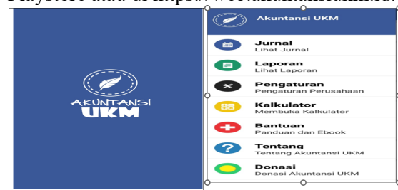
Gambar 4. Aplikasi Akuntansi UKM

Selanjutnya, kami baru memberikan penjelasan terkait penggunaan aplikasi pelaporan keuangan yang kami tawarkan. Aplikasi yang dimaksud adalah "Akuntansi UKM". Kami memberikan saran untuk menggunakan Aplikasi Akuntansi UKM yang dapat didownload secara gratis gratis di Playstore atau di https://web.akuntansiukm.id .