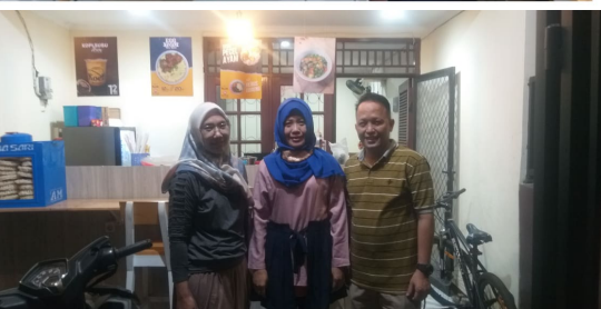
Gambar 5. kegiatan pengabdian masyarakat