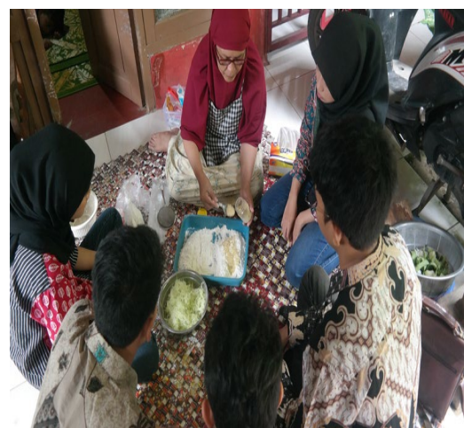
Gambar 2. Proses pembuatan salah satu produk dari PUJASERA