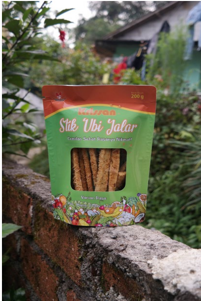
Gambar 3. Salah satu produk PUJASERA yang telah didokumentasikan