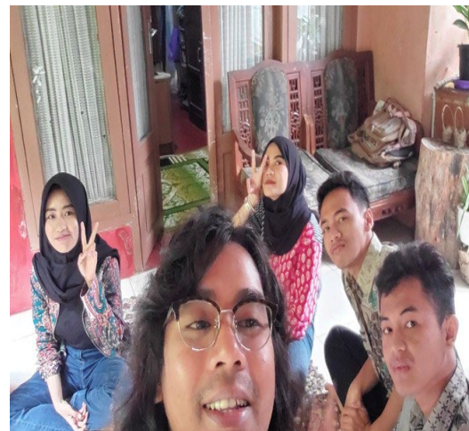
Gambar 1. Foto bersama di tempat produksi PUJASERA

Kegiatan ini dilakukan pada tanggal 15 Agustus 2022. Selain sebagai sarana promosi, penggunaan Blogspot menjadi salah satu bentuk peninggalan dari kelompok kami setelah KKN ini berakhir dengan harapan agar bisa seterusnya membawa manfaat sebagai media promosi bagi pemilik UMKM yang ada di sekitar desa Gedepangrango.