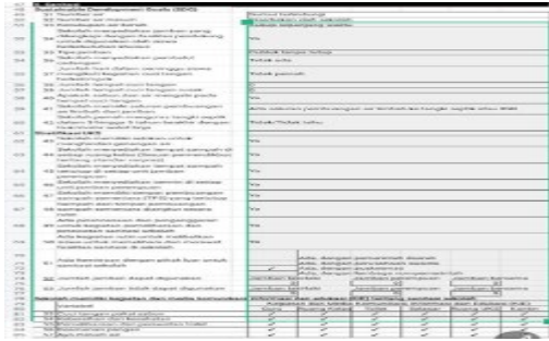
Gambar 1. Profil Sekolah