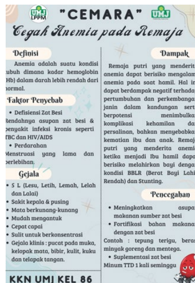
Gambar 1. Media Berupa Poster

penyuluhan yaitu mengenai anemia dan anjuran mengonsumsi TTD yang nantinya akan diberikan kepada para peserta saat sebelum dan sesudah penyuluhan berlangsung.