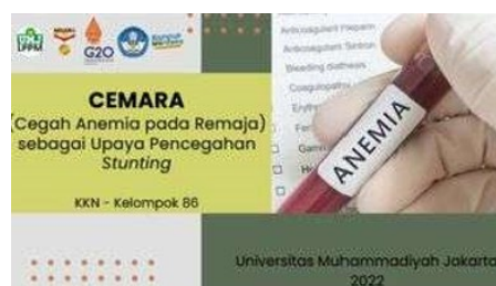
Gambar 2. Media Berupa Power Point (PPT)

Maka dari itu, melalui poster tersebut inti materi dan pesan yang ada di dalamnya dapat tersampaikan dengan baik kepada para siswi dan diharapkan untuk para siswi agar dapat mengimplementasikan di kehidupan sehari-hari. Untuk mengukur perubahan pengetahuan pada sasaran sebelum dan setelah intervensi, maka sasaran mengisi pre test dan post test berupa soal pilihan ganda berjumlah 10 soal.