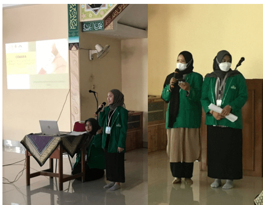
Gambar 3. Kegiatan Penyuluhan

etelah penyuluhan selesai kami mengadakan games untuk menambah semangat para peserta, tetapi karena adanya keterbatasan waktu dan waktu sudah memasuki Adzan Ashar sehingga kami harus memberhentikan gamesnya. Sebelum kegiatan penyuluhan ini di tutup, para peserta diberikan waktu sebentar untuk mengisi survey kepuasan peserta. Tidak lupa juga kami memberikan media tambahan berupa poster kepada para siswi sebagai informasi yang bisa dibaca dan dipahami kembali.