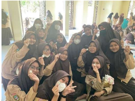
Gambar 6. Pemberian TTD Kepada Siswi

Selain penyuluhan, kegiatan yang kelompok kami lakukan adalah memberi suplemen Tablet Tambah Darah (TTD) kepada para siswi. Kegiatan ini kami pilih karena menjadi salah satu indikator keberhasilan dalam mengatasi anemia. Untuk pembagian suplemen Tablet Tambah Darah (TTD), siswi masing-masing diberikan 1 tablet untuk sekali minum.