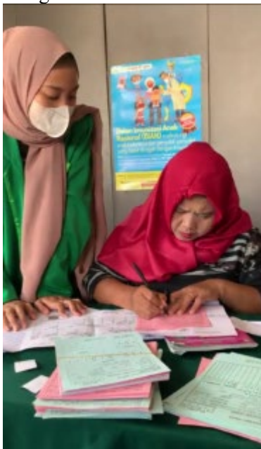
Gambar 4. Meja Pengisian KMS

Kartu Menuju Sehat (KMS) adalah kartu yang digunakan untuk pengisian pendataan dari hasil pengukuran, sehingga perkembangan dari anak dapat diketahui dana di baca data recordnya.