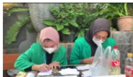
Gambar 2. Meja Pendaftaran Tempat dimana dilakukannya pendaftaran peserta kegiatan Posyandu guna didapatkannya data valid mengenai jumlah keseluruhan peserta yang mengikuti Posyandu.