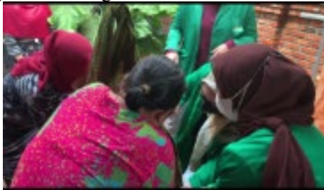
Gambar 3. Meja Penimbangan

Untuk balita yang telah dilakukann pendaftaran kemudian di timbang untuk data berat badan, diukur area kepala untuk mendapatkan data lingkaran kepala, diukur tinggi badan untuk mendapatkan data tinggi badan anak.