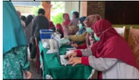
Gambar 6. Meja Pelayanan Kesehatan

Pada meja ini seperti tempat tindakan kecil yang dapat memberikan imunisasi, pemberian vitamin, konsultasi dan pengobatan ringan.