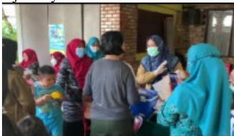
Gambar 5. Meja Penyuluhan

Berdasarkan data yang telah di isi pada KMS, maka petugas akan melakukan penyuluhan